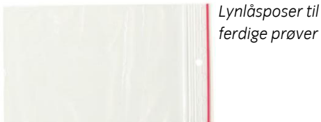
Lynlåsposer til ferdige prøver

I sendinga er det også blanke lynlåsposer for ferdige rør med vevsprøver, etiketter som skal settes på posene og en frankert returkonvolutt.